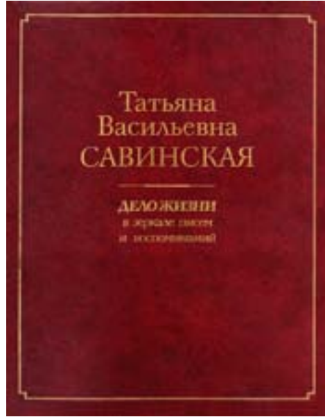
Т. В. Савинская. ДЕЛО ЖИЗНИ. Составитель И. В. Балакова