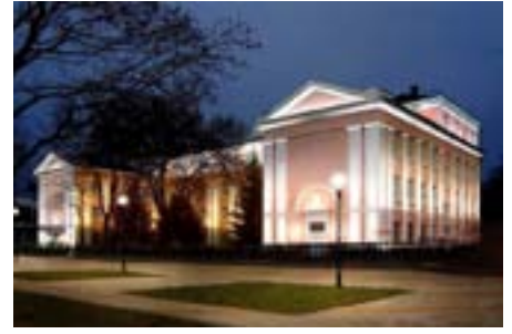
Современный вид лица № 48