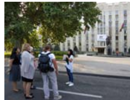
Пешеходные экскурсии «Советский Краснодар»