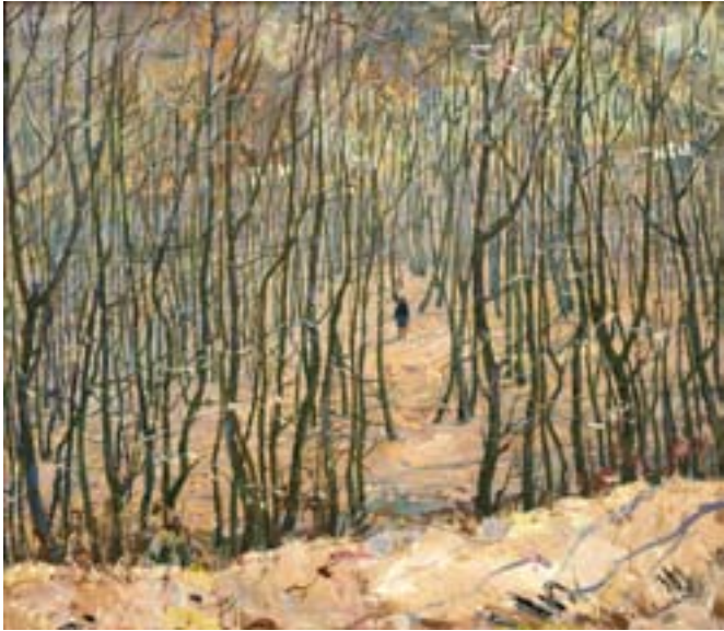
Сулименко П.С. Пробуждение. 1973