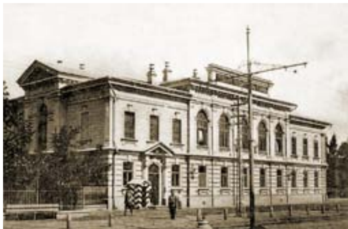
Здание Екатериновдарской конторы Госбанка, 1902 г., архитектор И.К. Мальгерб