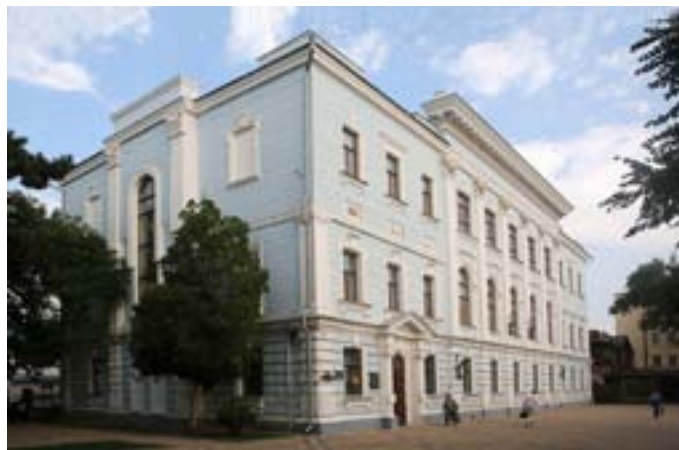
Выставочные залы Краснодарского краевого художественного музея им. Ф. А. Коваленко (здание Екатериновдарской конторы Госбанка, реконструкция 1954 г., архитектор Е.В. Краснова)