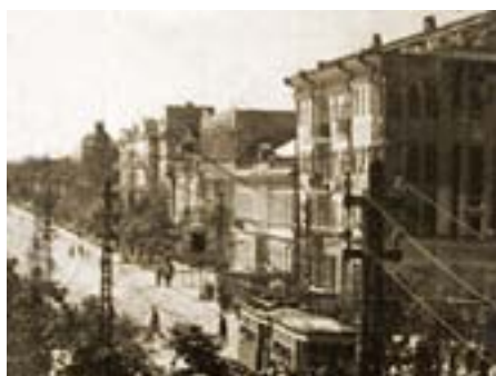
Жилой дом. 1920-е г.г., архитектор М.Н. Ишунин