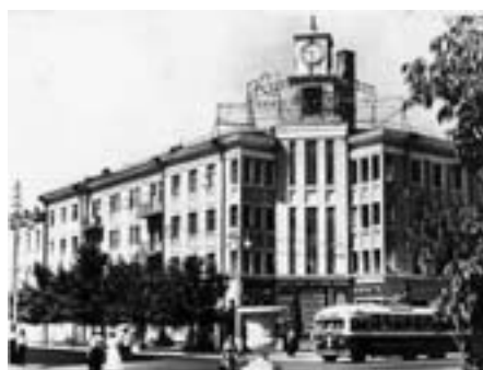
Жилой дом. Реконструкция 1950-х г.г.