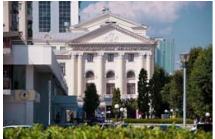
Краснодарская филармония им. Григория Пономаренко (до 1973 г. - театр драмы им. М. Горького)

архитектора Ф. Шехтеля. Позднее, после установления советской власти здание стало домом для труппы театра драмы им. М. Горького. В 1943 году здание серьезно пострадало, были уничтожены несущие конструкции и принимается решение о реконструкции. В начале 50-х годов восстановление было завершено, но фасад предстал перед горожанами в сильно измененном виде. Отныне мы видим здание оформленное в классическом стиле, что напомним, очень характерно для сталинского времени.