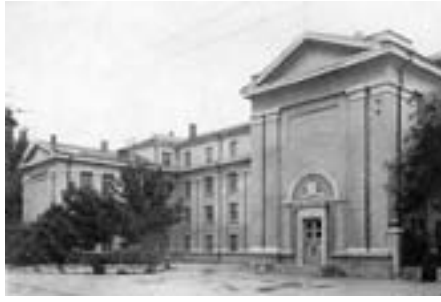
На месте Атаманского дворца. Школа № 48. 1952 г. Типовой проект