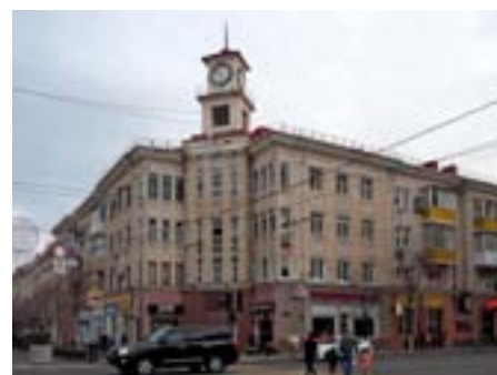
Жилой дом сегодня. Фото 2020 г.

В 1902 году на плановом месте купленном у потомков атамана Рашпиля было заложено и за год возведено здание конторы госбанка. Проект простого и лаконичного здания в стиле неоклассицизм принадлежал авторству екатериновдарского зодчего Ивана Климентьевича Мальгерба. Симметрия, простые формы, классический декор – во всем простая и сдержанная классика. О начале XX века напоминают лишь два «креативных» момента, это смещение входа от центра в правый объем и отступ от красной линии, что делает и здание и пространство перед ним более просторным и легким. А если взглянуть на здание с юго-востока то можно заметить как игриво и в такт вторят друг другу сандрик над входом и фронтоном южного фасада.