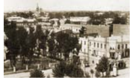
Вид с войскового Александро-Невского собора. 1913