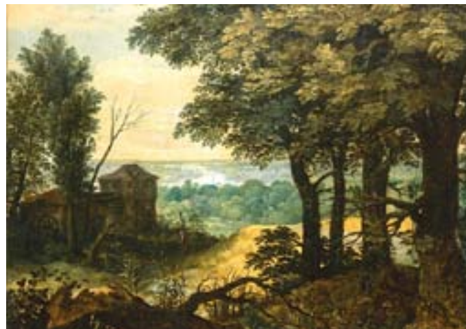
Неизвестный художник XVII в. Пейзаж с мельницей