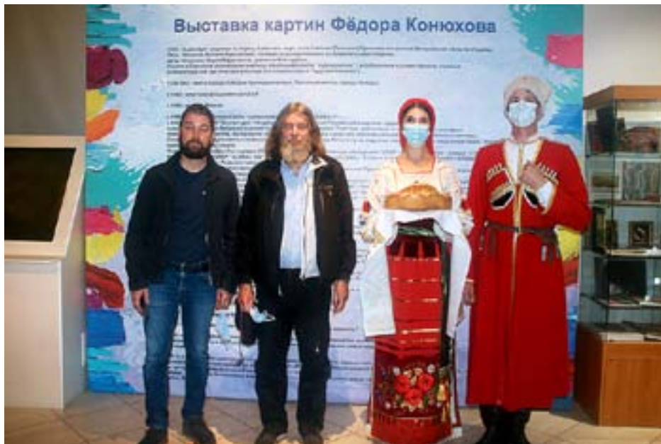
Открытие выставки Фёдора Конюхова «Палитра Пилигрима». 2020