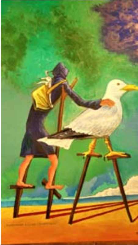
Ф. Конюхов. Возвращение. 2017