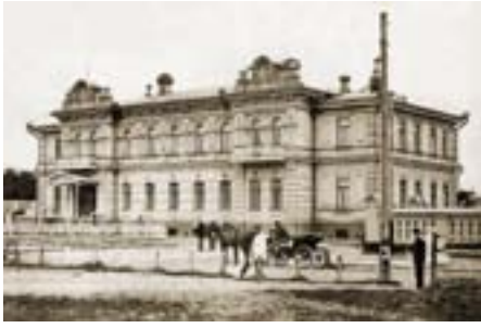
Атаманский дворец. 1895 г. Архитектор Н. Малама