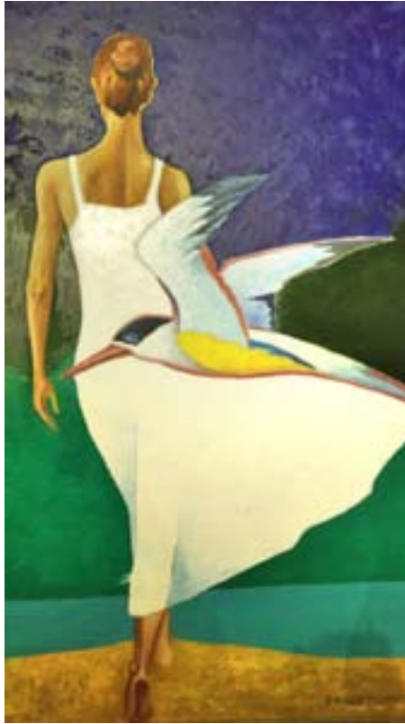
Ф. Конюхов. Уходящая. 2010