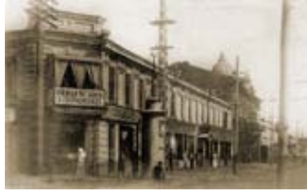
Книжный магазин Галладжянс. 1917