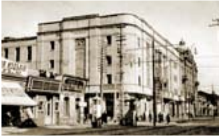
Зимний театр. 1909. Архитектор Ф.О. Шехтель