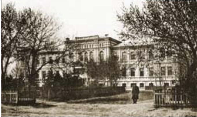
Здание окружного суда. 1896 г.