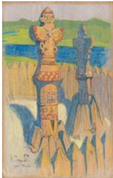
Рерих Н.К. Идолы. 1901