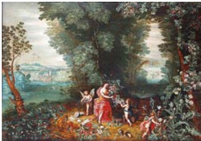
Хендрик ван Бален (старший), Неизвестный художник II половины XVII в. Лето. Копия