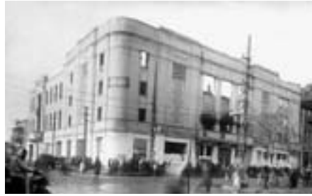
Зимний театр, после 1920 года – Краснодарский академический театр драмы им. Горького. 1943