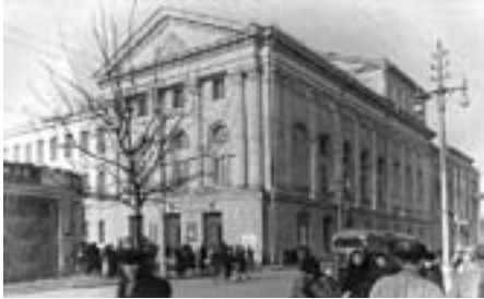
Театр драмы им. М. Горького после реконструкции. Архитектор А.В. Титов. 1954