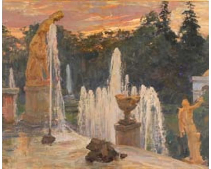
Шлуглейт И.М. Большой грот