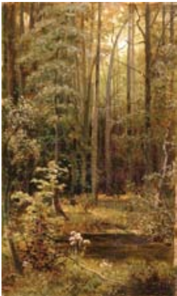
Шишкин И.И. В лесу. 1880-е