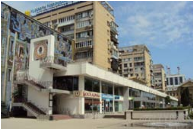
Краснодарский Дом книги, 1977 г., архитектор А.Г. Якименко