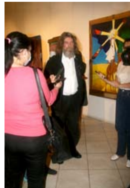
На открытии выставки Фёдора Конюхова «Палитра Пилигрима». 2020