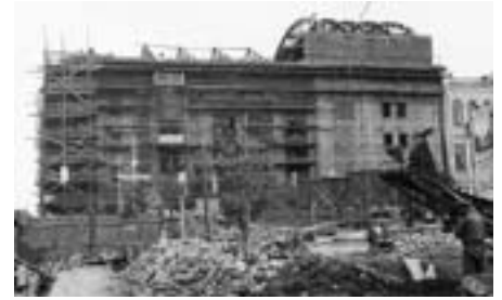
Восстановление театра драмы им. М. Горького. 1953