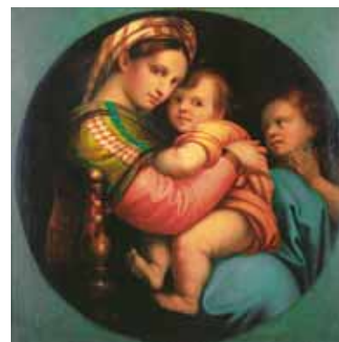
Рафаэль (Рафаэлло Санти) Мадонна в креслах Копия Джузеппе Паррини выполнена в 1898 г. по заказу Ф. А. Коваленко с оригинала галереи Питти (Флоренция)