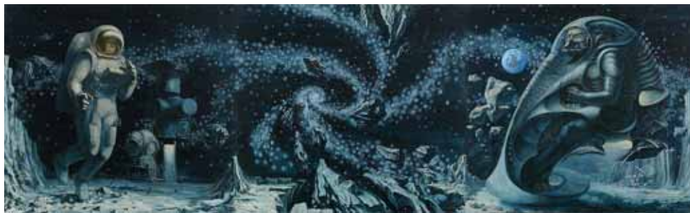
Триптих «В море Ясности». 2016.