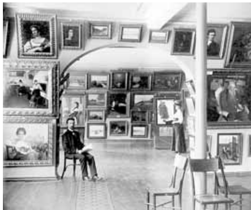
Фото. Ф. А. Коваленко. Экспозиция в здании городской управы