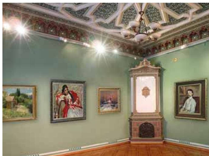
Мемориальный зал Ф. А. Коваленко

Второй блок – русская реалистическая живопись в традициях «передвижничества». Данную особенность коллекции Коваленко отмечал еще Р.К. Войцик. Федор Акимович почитал творчество «Товарищества передвижных художественных выставок», обращавшихся к социальным проблемам своего времени, создавших множество психологических