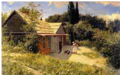
Киселев А. А. Дача в Крыму. 1906