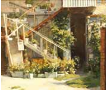
Дворик залитый солнцем. 2006.