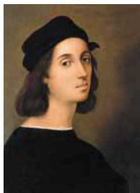
Рафаэль (Рафаэлло Санти) Автопортрет Копия Джузеппе Паррини выполнена в 1898 г. по заказу Ф. А. Коваленко с оригинала галереи Уффици (Флоренция)