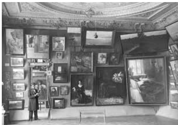
Фото. Ф. А. Коваленко. Экспозиция в особняке Б.Б. Шарданова