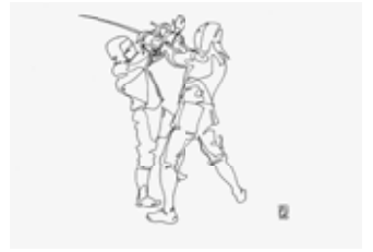
Графический проект «Фехтбух»

был посвящён второй зал, в котором демонстрировались диптих «Две судьбы» (2015), живописные и графические работы «Отец» (2017), «Мама» (2006), «Бабушка» (2004), «Соната воспоминаний» (2015), «Ожидание. Муркин день» (2005), «Дворик, залитый солнцем» (2006).