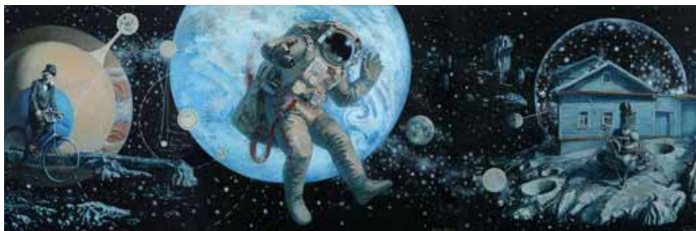
Триптих Луна-16. 2017