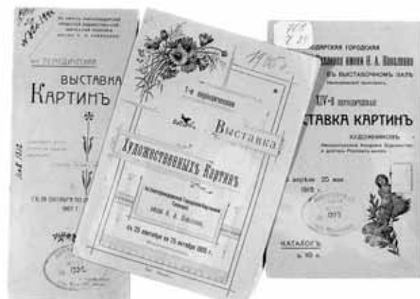
Каталоги периодических выставок в галерее имени Ф.А. Коваленко