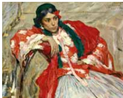
Харитонов. Н. В. Цыганка. 1908