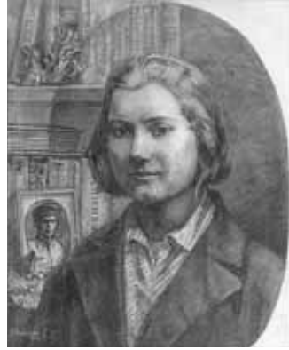
Диптих «Две судьбы». 2015.