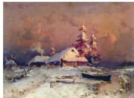
Клевер Ю.Ю. Зимний вечер