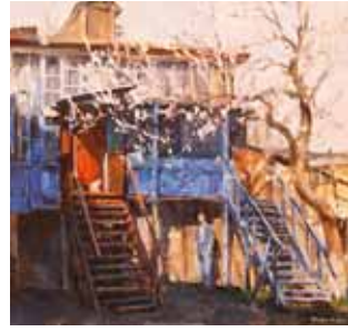
Ожидание или муркин день. 2005.