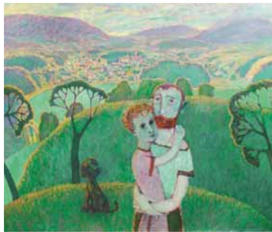
Пугач И.В. Жизней сплетения