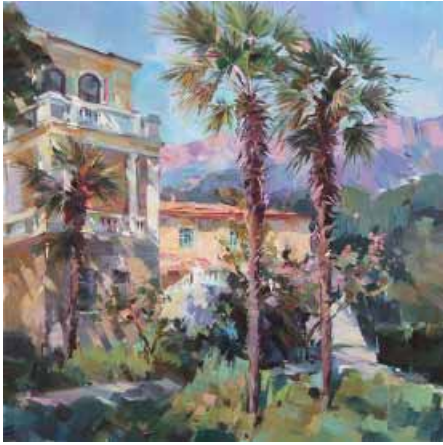
Калюжная А. Н. Лиго Морская. Симеиз