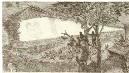
Егоров В. Я. Летний кинотеатр