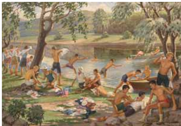
Козлов В. С. Пионеры на берегу реки