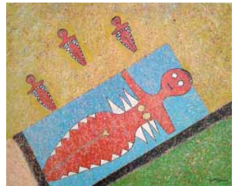
Шмагин В. Н. Жаркое солнце

радостью купающихся детей. Картины Евгении Малеиной «Дети на каникулах» и Евгения Грибова «Клевало плохо» с одним сюжетом, но разные по настроению. Сколько удовлетворения и счастья на лицах мальчишек, возвращающихся с уловом. Наверно, не случайно у Евгения Грибова ребята написаны со спины. Не хотелось ему показывать расстроенные лица детворы. Нет сегодня улова. Бидон пуст.