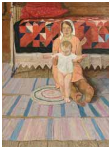
Ткачев А.П., Ткачев С.П. Первые шаги