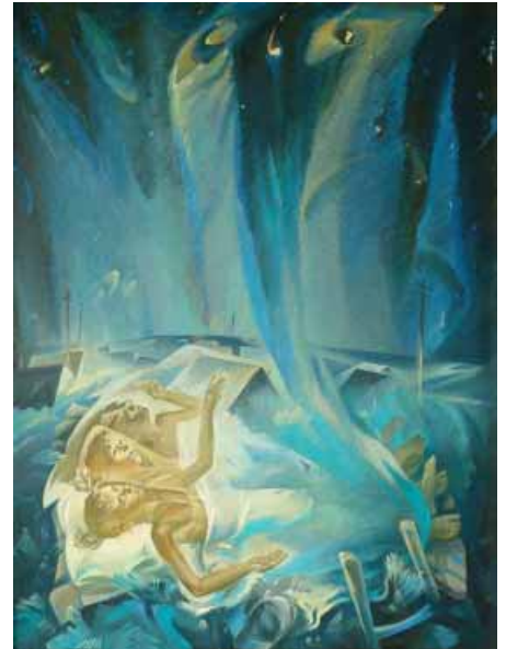
Туров Г. К. Мечтатели