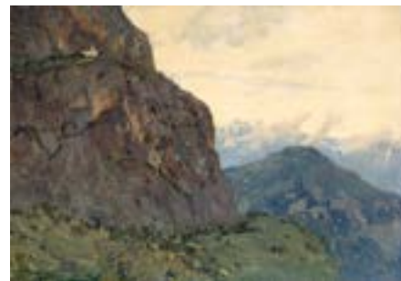
Левитан И. И. Горный пейзаж. Альпы. 1897