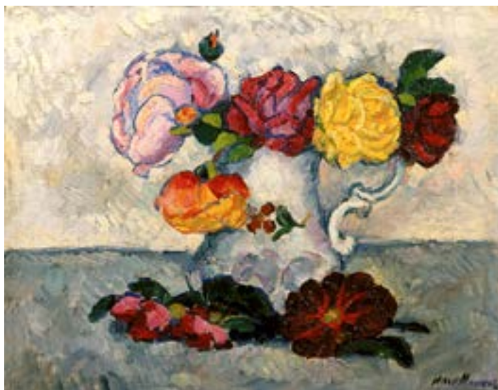
Машков И. И. Цветы в белом кувшине