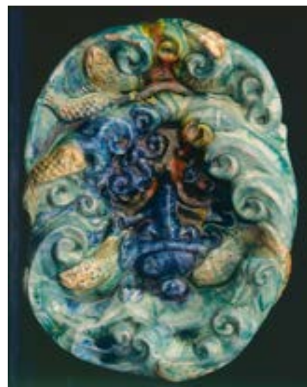
Врубель М. А. Морской царь. 1920-е

И конечно же работы мастера «пейзажа настроения» И. Левитана: «Горный пейзаж», «Золотая осень», «Избы, освещенные солнцем», «Берег моря».