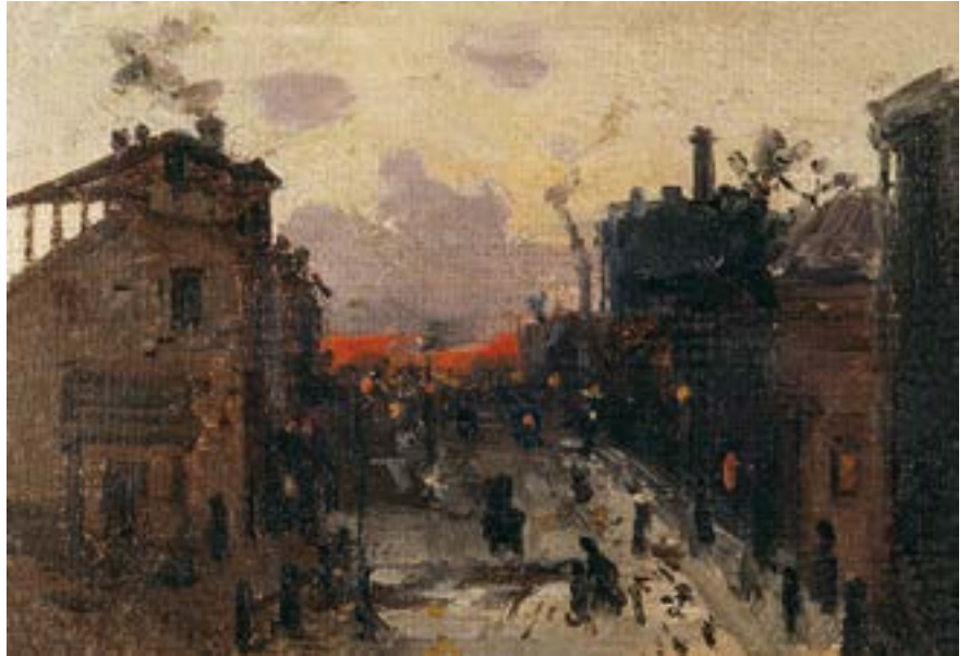
Коровин К. А. Закат на окраине