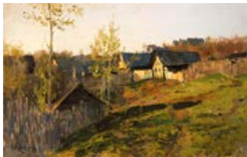
Левитан И. И. Избы, освещенные солнцем. 1889