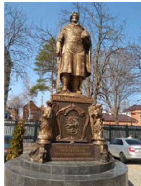
Памятник святому благоверному князю Александру Невскому

памятники Краснодар»; «Александр Невский и кубанское казачество», рассказывающей о роли святого благоверного князя в жизни кубанских казаков.