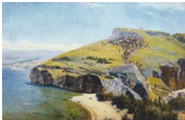
Поленов В. Д. Палестинский пейзаж. 1880-е