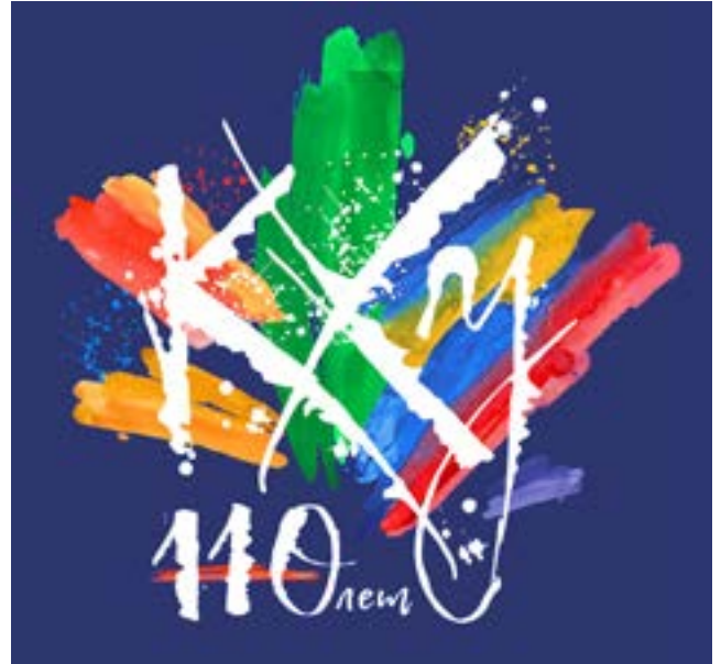
Афиша Краснодарского художественного училища