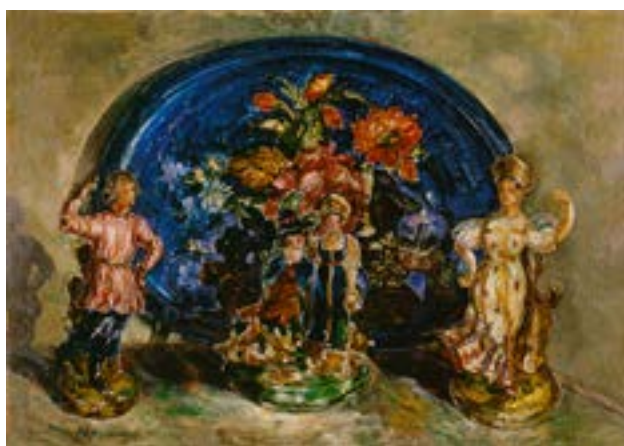
Судейкин С. Ю. Натюрморт с фарфоровыми фигурами. 1910-е

Выставка активно освещалась в СМИ, вызвала большой интерес со стороны публики и стала дополнительным поводом для показа музейной коллекции.