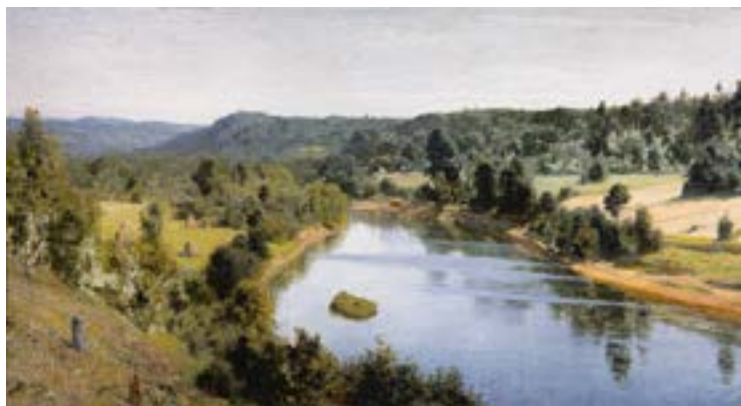
Поленов В. Д. Река Оять