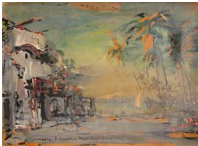
Коровин К. А. Эскиз декорации к опере «Самсон и Далила». 1916

породили огромное количество эскизов, которые являются полноценной частью творчества Коровина. Они хранятся в разных музеях, центрах, частных коллекциях, как в России, так и за рубежом. Один из них – эскиз к опере «Самсон и Далила».