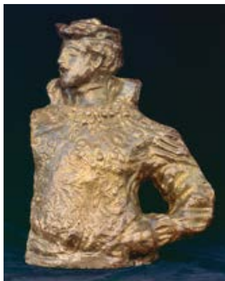
Врубель М. А. Мизгирь. 1920-е