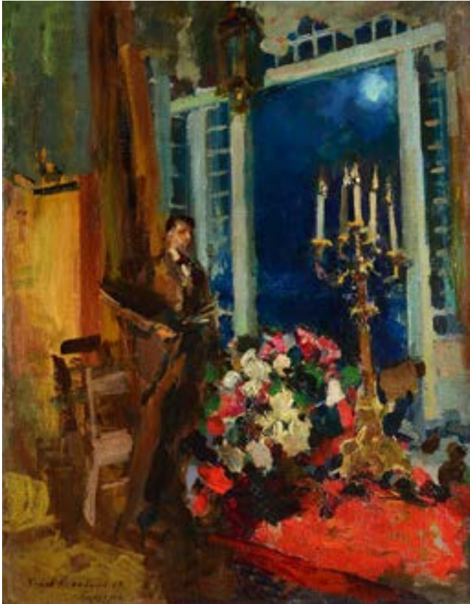
Коровин К. А. Ночь на юге. 1915 Ростовский областной музей изобразительных искусств