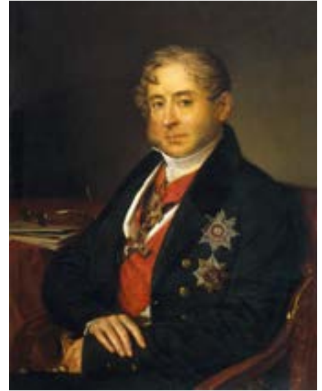
Тропинин В. А. Портрет князя С. И. Гагарина. 1836