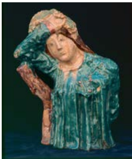
Врубель М. А. Купава. 1920-е