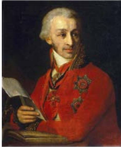
Боровиковский В. Л. Портрет Ф. А. Голубцова. 1806