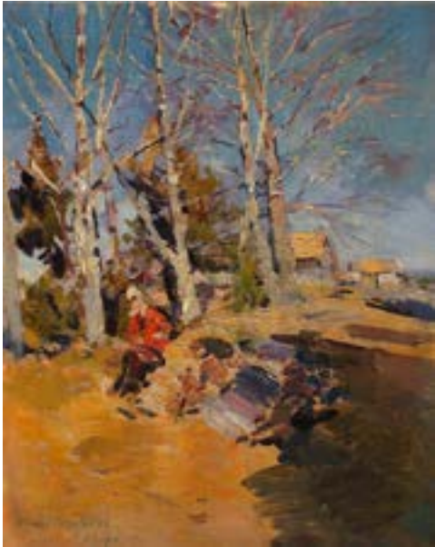
Поленов В. Д. Палестинский пейзаж. 1880-е