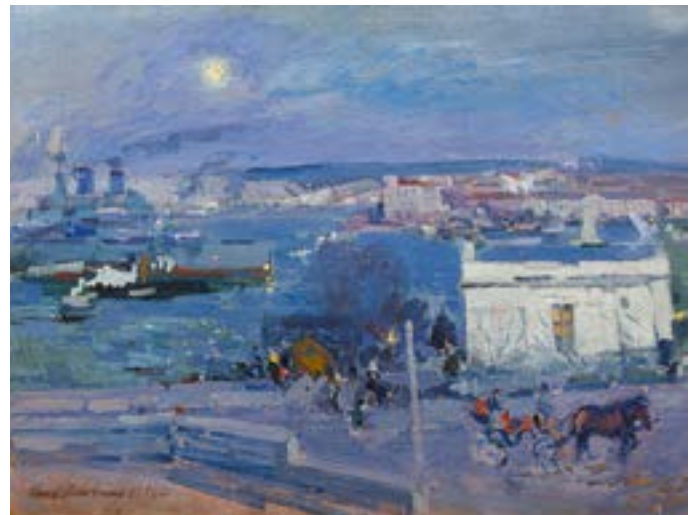
Коровин К. А. Гавань в Севастополе. 1916

мотивы. Многие в творческой биографии Коровина связано с родными местами. Вышний Волочек – места детства, Охотино, где художник построил себе дачу, Удомля и Островно, где художник провел трудные для страны годы гражданской войны и революции. Все эти «русские» места проходят через все творчество художника. Таков пейзаж «Осень. Солнечный день».