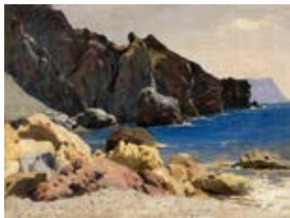
Левитан И. И. Берег моря. Крым. Этюд. 1880-е