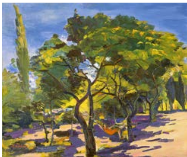
Сарьян М. С. Абрикосовые деревья