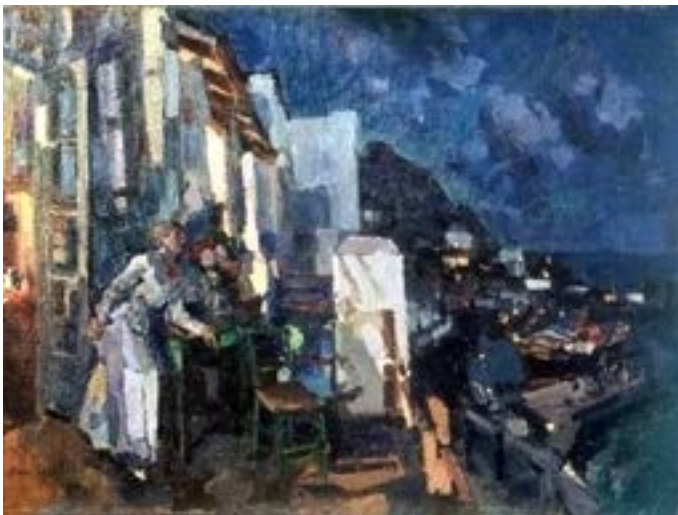
Коровин К. А. Вечер на веранде. 1914 Ростовский областной музей изобразительных искусств