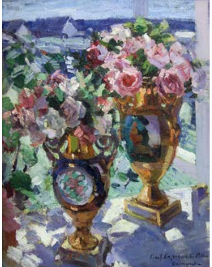
Коровин К. А. Розы. 1916 Ростовский областной музей изобразительных искусств