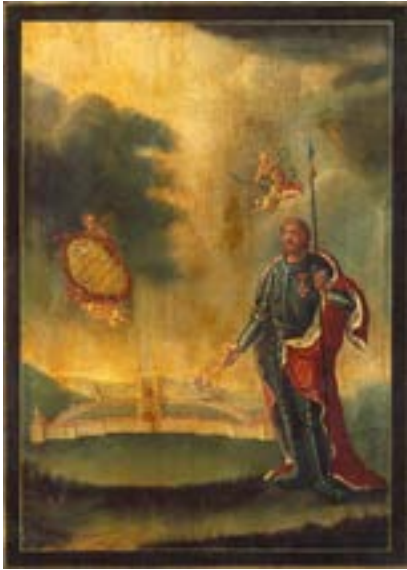
Св. Александр Невский. XVIII в.