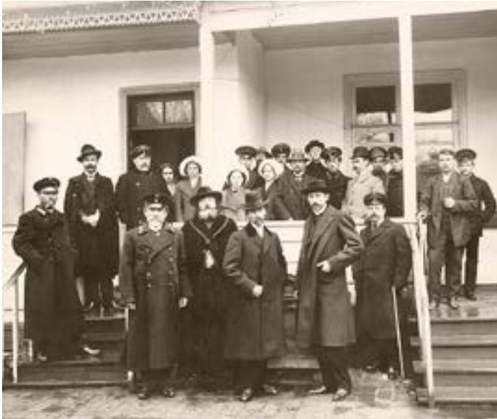
Ф. А. Коваленко на открытии художественного училища. 1911