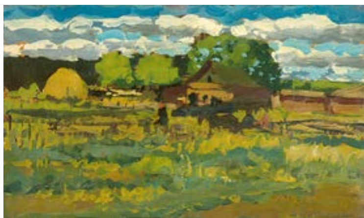
Туржанский Л. В. Пейзаж с домиком