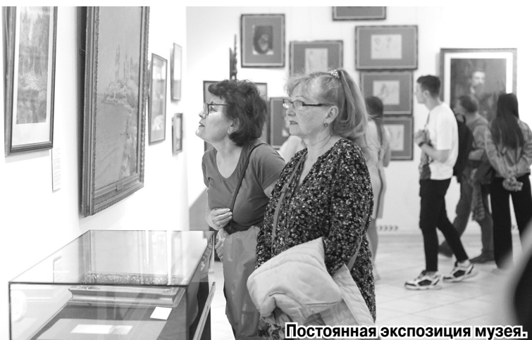
Постоянная экспозиция музея.